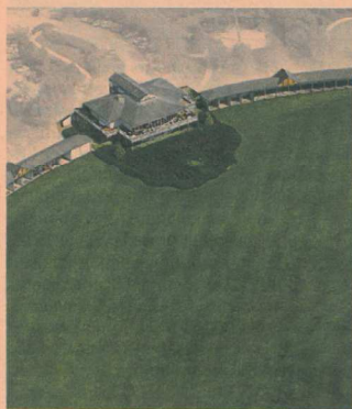
Après l'Euro 2016, la Ryder Cup 2018 se jouera-t-elle à Saint-Etienne ?